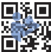
Montageanleitung (im Lieferumfang enthalten)